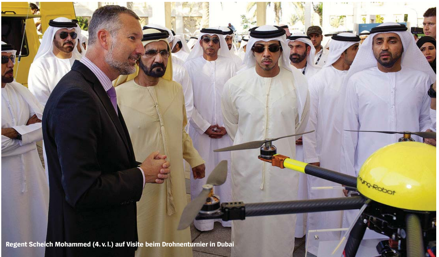
Regent Scheich Mohammed (4. v. l.) auf Visite beim Drohnenturnier in Dubai