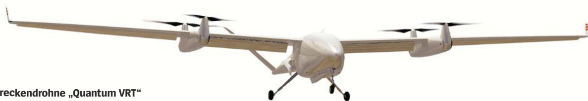
Langstreckendrohne „Quantum VRT“

Transplantationsklinik. Junge Frauen im Schwesternkittel führten auf der Bühne ein kleines Retterdrama auf: Zum lieblichen Gebimmel einer Spieluhr flog ihre Drohne ein rotes Plastikherz über den See – die Jury war bezaubert.